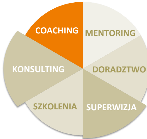
Rys. 1. Coaching a inne formy wspomagania w rozwoju

Duża popularność coachingu sprawia, że tą nazwą określa się dziś wiele różnych pokrewnych form wspierających rozwój. Są one często mylone lub kojarzone z coachingiem. Każda z nich jest użyteczna i ma swoje miejsce w procesie wspierania rozwoju. Znajomość metod i różnic występujących między nimi, a także umiejętność posługiwania się nimi, umożliwi ich właściwy dobór do określonego kontekstu oraz elastyczność w działaniu. Stosowane zgodnie ze swoim przeznaczeniem mogą być bardzo skutecznymi narzędziami pomagającym w osiągnięciu sukcesu.