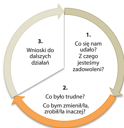
Rys. 3. Refleksja grupowa