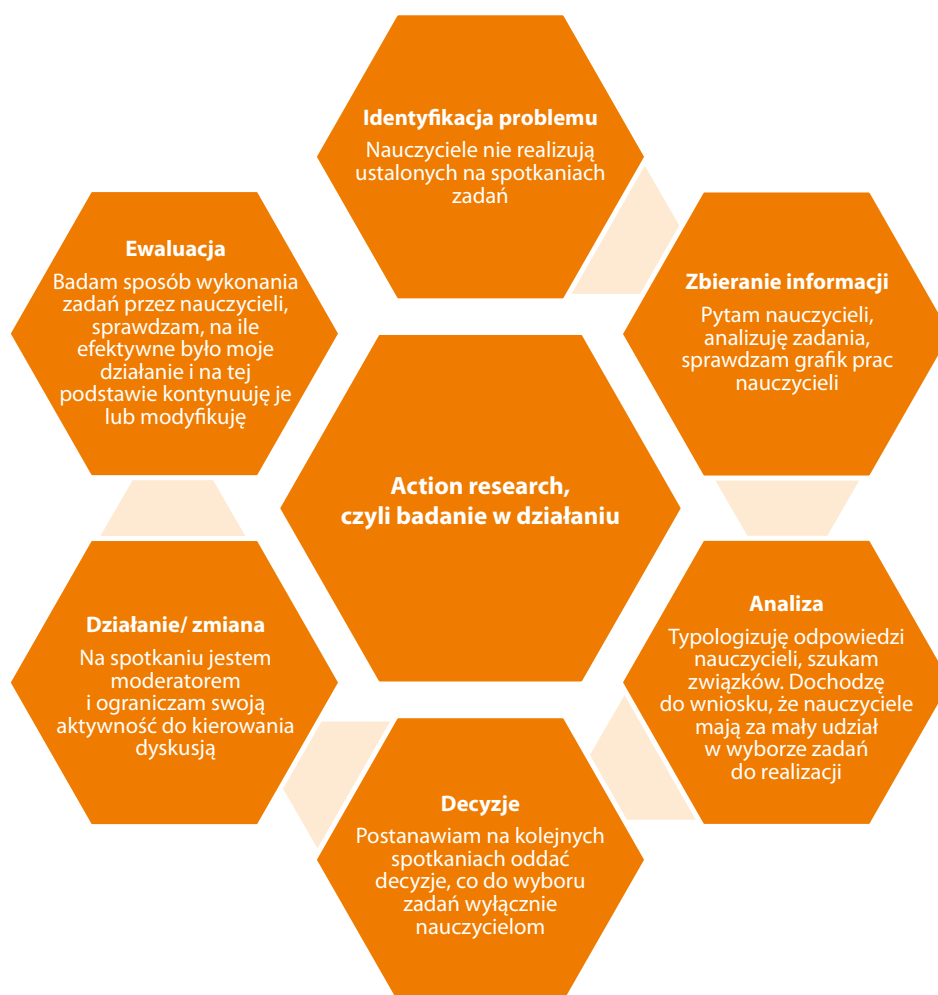
Rys. 5. Badanie w działaniu