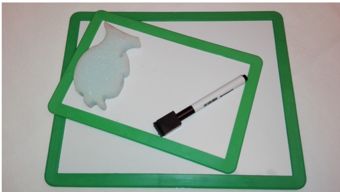
Ryc. 4. Dwie białe, metalowe tabliczki suchościernalne, jedna w formacie A4, a druga A5 oraz pisak do tablic suchościernalnych i gąbka