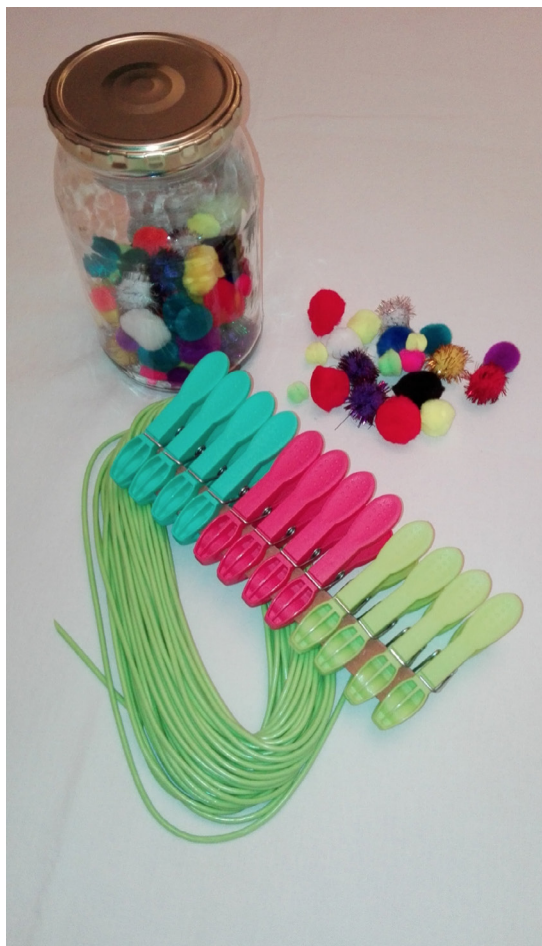
Ryc. 2. Słoik i kolorowe pompony, linka do prania i klamerki.

Nauczyciel powinien być kreatywny. Spróbuj puścić wodze fantazji i wygeneruj jak najwięcej pomysłów na wykorzystanie na zajęciach: